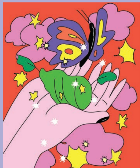
© Spl! Girl pour Caravansérail, 2024

Une activité d'ouverture aura lieu le dimanche 18 mai , de 13 h à 15 h.