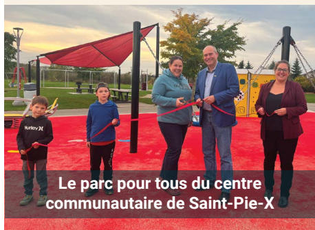
Le parc pour tous du centre communautaire de Saint-Pie-X

Jeux psychomoteurs, sensoriels et créatifs, ce parc est facilement accessible pour les personnes vivant avec un handicap.