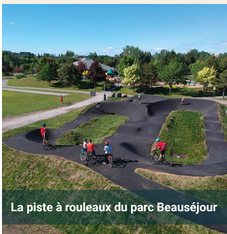
La piste à rouleaux du parc Beauséjour

Le fameux « pumptrack » est devenu avec les années l'une des installations sportives les plus populaires de Rimouski. Une piste à rouleaux est une installation composée de bosses arrondies et de virages relevés qu'il est possible de franchir sans pédaler, ou presque.