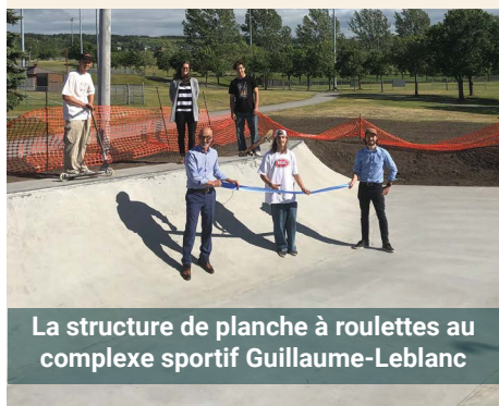
La structure de planche à roulettes au complexe sportif Guillaume-Leblanc

Situé derrière l'édifice Claire-L'Heureux-Dubé, le « skatebowl » est un endroit de choix pour les jeunes sportifs. Depuis quelques années, l'installation est devenue un lieu de prédilection pour bouger en période estivale.