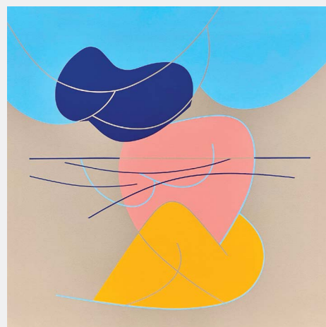
La tête dans les nuages (2023)

J'ai travaillé sur le devenir des villes en design urbain à de nombreux endroits dans le monde. J'ai donc été amené à avoir un souci particulier du paysage rural, urbain, forestier et maritime. Le paysage étant le regard qu'on porte sur le territoire, c'est un pont vers l'art et les œuvres que je crée. L'appel des horizons représente aussi le souhait que j'ai toujours eu de voir ce qui se cache de l'autre côté de l'horizon ou de « l'autre bord ». L'horizon et ses lignes ont été une forme d'appel qui m'a amené au Québec.