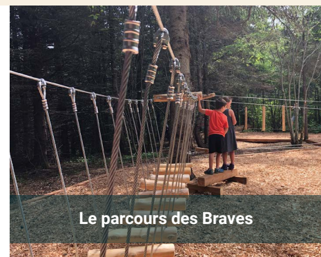
Le parcours des Braves

Situé derrière l'édifice Claire-L'Heureux-Dubé, le « skatebowl » est un endroit de choix pour les jeunes sportifs. Depuis quelques années, l'installation est devenue un lieu de prédilection pour bouger en période estivale.